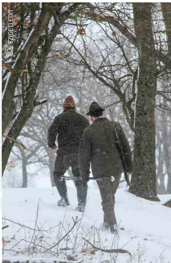
10 SZUCETI EDIT

A vadászatra jogosult köteles az állat-egészségügyi okból elejtett vadat vizsgálatra alkalmas módon az elejtés helye szerint illetékes hatósági állatorvosnak bemutatni. A hatósági állatorvos az elejtés indokoltságáról igazolást állít ki.