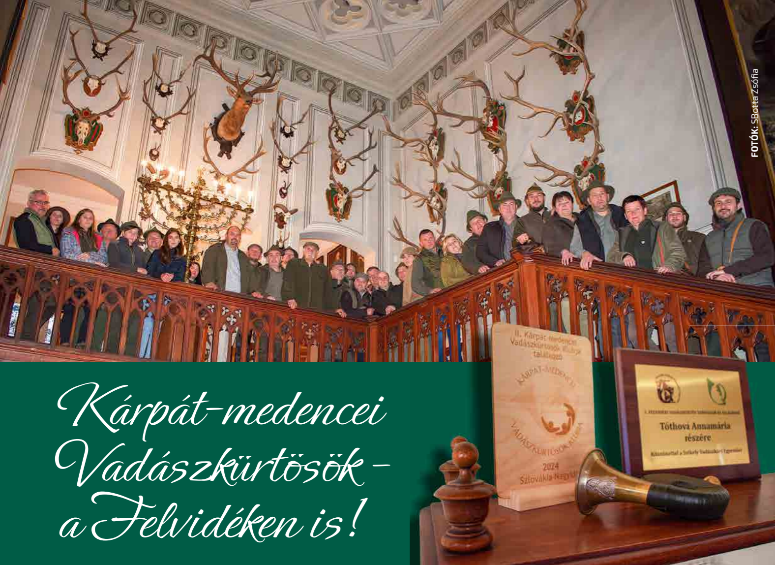
FOTÓK: Spötter Zsófia