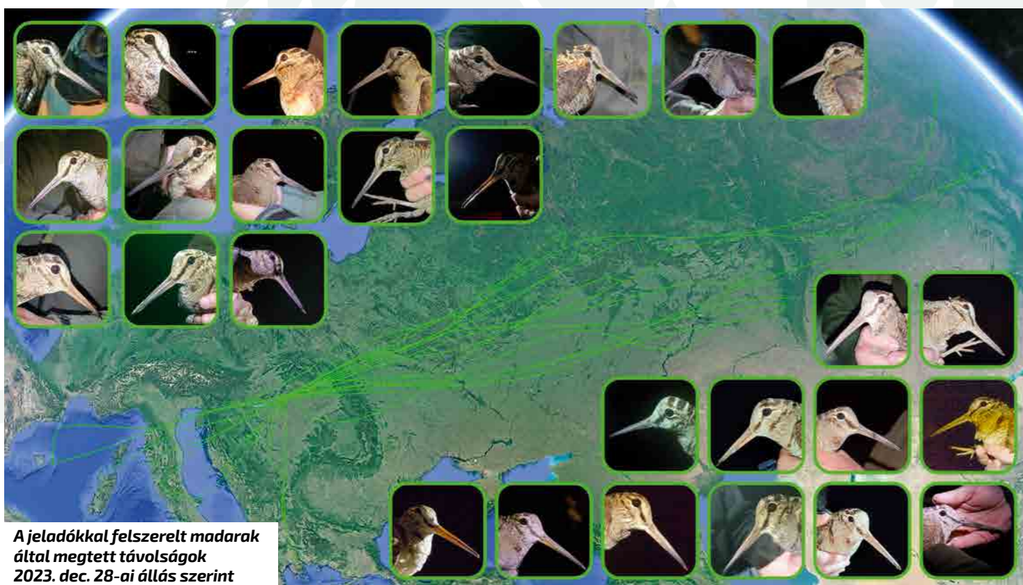
A jeladókkal felszerelt madarak által megtett távolságok 2023. dec. 28-ai állás szerint

A megfigyelési és elejtési jegyzőkönyvek mellett minden elejtett egyedről szármintát is kell szolgáltatni az Országos Vadgazdálkodási Adattár (OVA) részére, a szárnnyelvények alapján történő korhatározás céljából. Az elejtett madarak ivara boncolással könnyen megállapítható, ezt az elejtők továbbra is kellő bizonyossággal el tudják végezni.