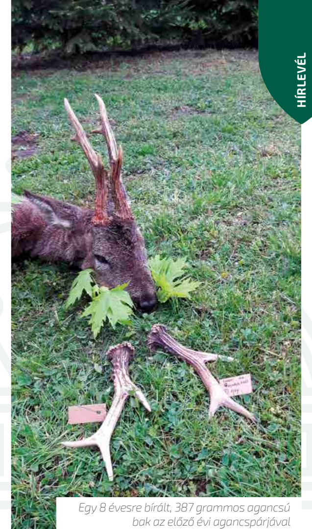
Egy 8 évesre bírált, 387 grammos agancsú bak az előző évi agancspárjával

Mára a 4000 hektáros vadászterületünkön 65 őz-önetető van, hogy minél jobban ki tudjuk használni az őz élettani sajátosságait (kis otthonterület, sokszor kis családokban él stb.). Korábban ezt osztrák kollégáink is jelezték: minél több etető lesz, annál több jó bakot tudunk majd megtartani, mert a területükhöz ragaszkodó bakok az etetők környékére fognak beállni, és értelemszerűen több etetőnél kisebbek lesznek az otthonterületek, így kevesebb az elvándorlás. Ma már területünkön 8 tonna ősztápot etetünk (amit általában Ausztriából szerzünk be) kevés búzával, kukoricával és több zabbal, árpával keverve. Az etetőket üzekedés végén feltöltjük,