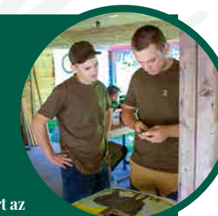
Fotó: Botta Zsófia

Az Országos Magyar Vadászkamara Fegyverügyi és Vadászlövész Szakbizottsága válogatót tart az idén Szlovákiában megrendezésre kerülő II. Nemzetközi Ifjúsági Lövészversenyre. A válogató célja, hogy a legfelkészültebb és leghetségesebb fiatal lövészek képviselhessék Magyarországot a nemzetközi mezőnyben.