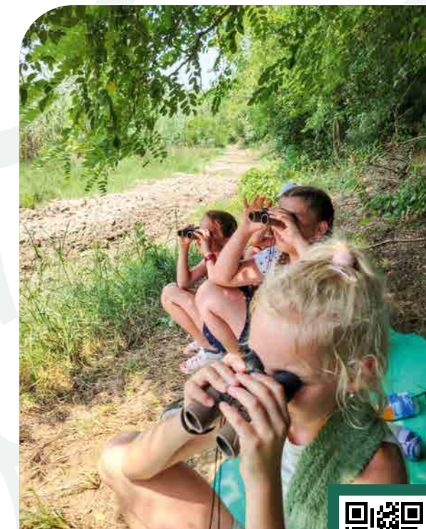
A Nimród Vadászújságban 2023 őszén megjelent cikk