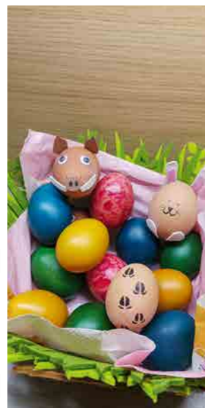
Grüll Bianka (Mór)