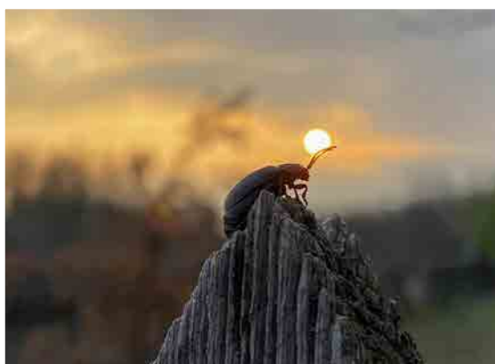
Gacsári-Kiss Zsombor (Kecskemét)