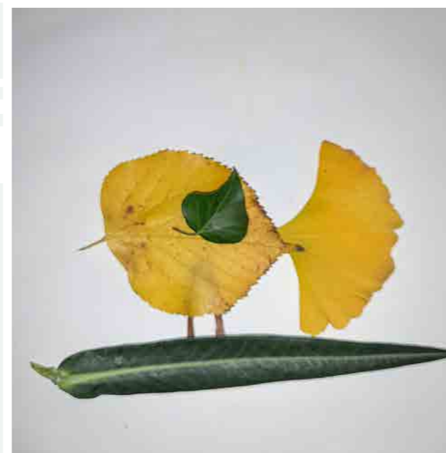
Komoly Viola (Hódmezővásárhely)