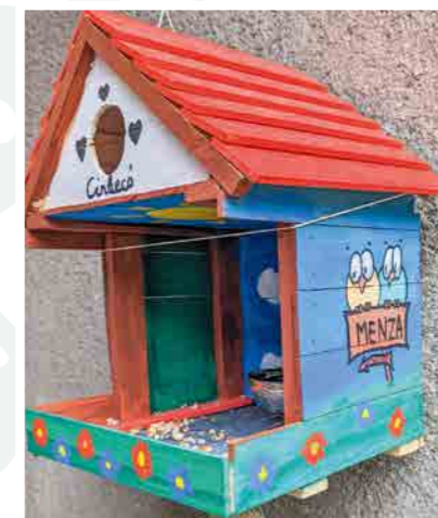
Hoós Dorottya (Budapest)