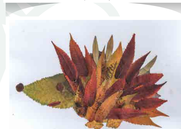
Vörös Máté (Szabadka, Szerbia)

I. ÉVFOLYAM, 2. SZÁM (tél) – madáréletterő készítése